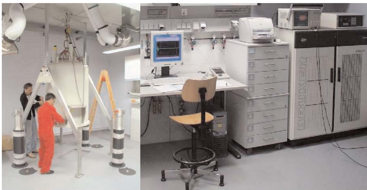
Fig. 2.: Installation of the B_0 = 11.74 T magnet (left) and a view onto the console during the first experiments of the new 500 MHz NMR spectrometer (right).

In addition to both commercially available NMR spectrometers a NQR spectrometer with two probes was designed and successfully tested (frequency range: 10 MHz – 130 MHz). Fast NQR investigations at 4.2 K (77 K) could be performed directly in the Helium (Nitrogen) vessel. Temperature dependent studies between 1.3 K and 330 K